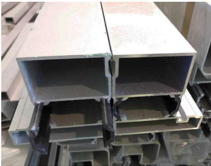
Figura 2 – Perfis estruturais duplos intermediários

Como se pode observar nas figuras acima, um conjunto de perfis tubulares metálicos interno e externo, totalmente independentes, são conectados entre si por perfilados plásticos intermediários.